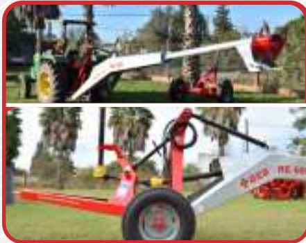
Sistema dual : con ruedas o tres puntos