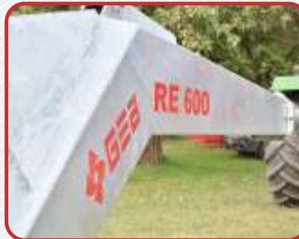
Galvanizado en caliente