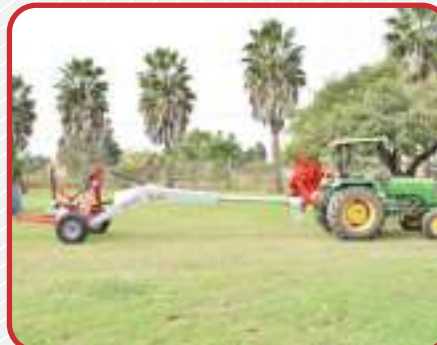
Posición de transporte