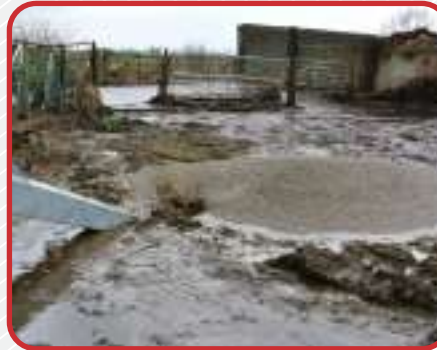
Rápida acción de mezcla