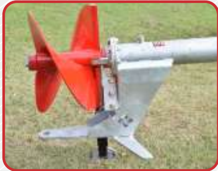
Turbina con contracuchillas. Pie de apoyo.